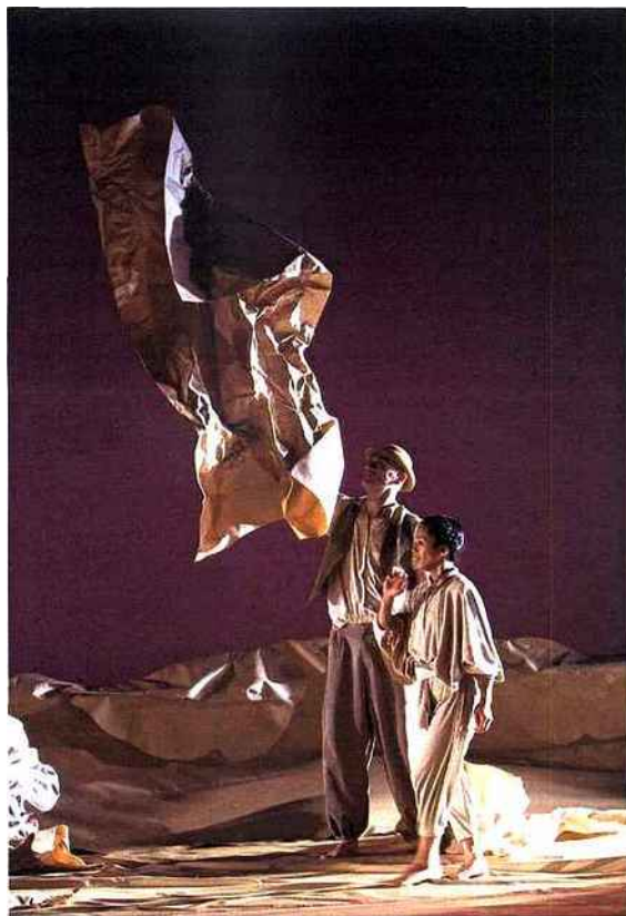
Le papier et le carton comme vaste métaphore d'une humanité froissée, sans abri. AGATHE POUPENY

Au Théâtre du Rond-Point des « Voyageurs immobiles » entre mime, danse, théâtre d'objets et de marionnettes